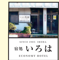
SINCE 1905 IROHA 宿処 いろは ECONOMY HOTEL